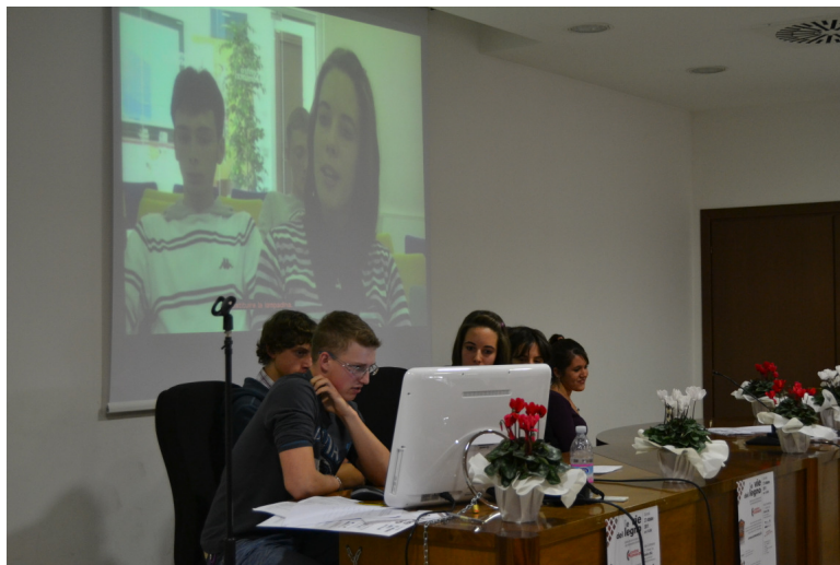
Il momento in cui il gruppo grafica ha presentato il video realizzato durante il corso

Referente: Sig. Gianpiero Losso - Tel. 0437 851320 - losso@centroconsorzi.it