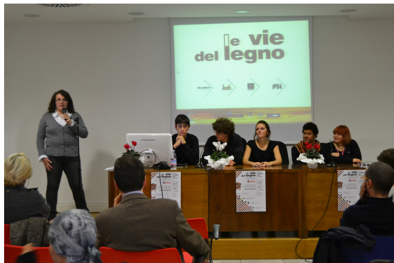
Il momento in cui in gruppo web-marketing ha presentato il sito realizzato durante il corso

Al termine sono stati consegnati gli attestati di partecipazione.